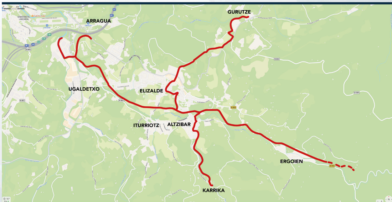
Red de bidegorris de Oiartzun

Para impulsar el uso del transporte público es imprescindible ampliar y mejorar el servicio de autobuses que une Oiartzun y San Sebastián. La competencia para la organización del servicio de autobús interurbano corresponde a la Diputación Foral de Gipuzkoa. En los últimos el Ayuntamiento ha solicitado a la Diputación la implantación de dos nuevos servicios: el autobús directo de Oiartzun a San Sebastián y el autobús directo de Oiartzun al Hospital. A pesar de la falta de respuesta de la Diputación, el Ayuntamiento seguirá trabajando para que se empiecen a ofrecer estas dos nuevas líneas de autobús.